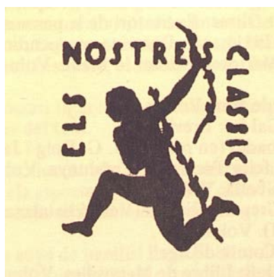
Segell de la col·lecció "Els nostres clàssics"